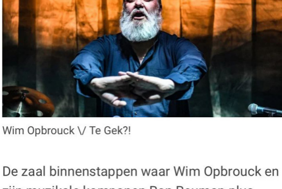
Wim Opbrouck / Te Gek?!

TeGek?! vroeg aan Wim Opbrouck om voor de 2022-campagne die focust op depressie een gelegenheidsvoorstelling te maken. De West-Vlaamse bard nam de kans met beide pollèn om in alle schoonheid en intimiteit loos te gaan in 'Ik ben de walvis'.